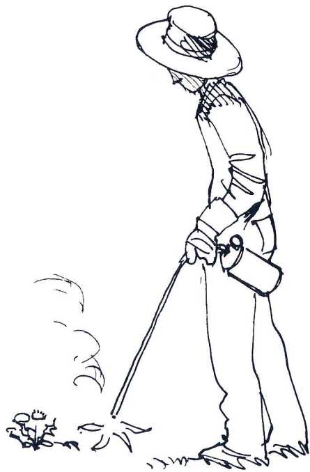
Text: Ingela Jagne Ill: Ingela Jagne och Han Veltman

Upprepade behandlingar kan hjälpa även mot roto-gräs. Spruta/duscha ut ca 2 dl per m 2 .