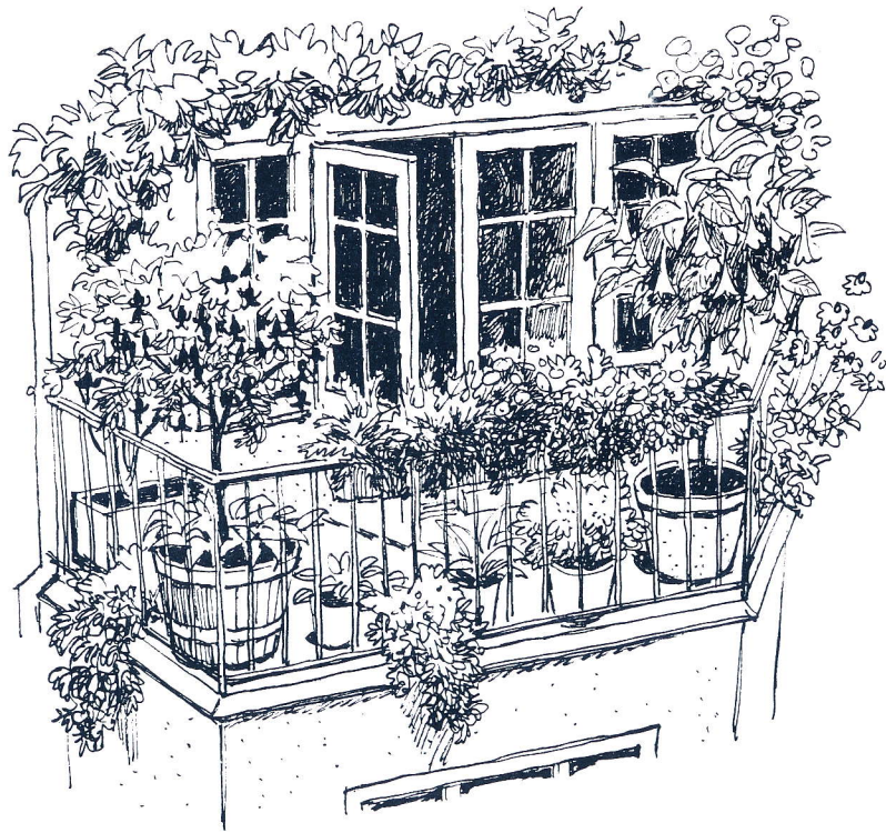
Solveig Sidblad, text Han Veltman, illustrationer

När säsongen är över för ettåringarna är det dags att tömma odlingskärlen och rengöra dem ordentligt inför vinterförvaringen. Jorden kan återanvändas som krukjord om den blandas med gödsel, kompost eller ny jord men också komma väl till pass som jordförbättring eller inblandning i komposten.