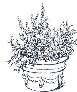
Samodla blommor och kryddor.

Kryddor och köksväxter passar också i krutor t ex värmeålskande basilika och rosmarin men också tomat, gurka och paprika (på solig och skyddad plats). Sallat, kålväxter, dill och fänkål gör sig utmärkt bland blommorna.