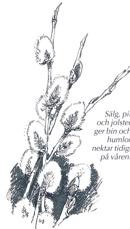
Sälg, pil och jolster ger bin och humlor nektar tidigt på våren.

När jordbruks- och beteslandskapet blir blomfattigare blir våra trädgårdar allt viktigare. Tack vare den vattning som sker brukar det finnas blommor även under torrperioder. När vi vet att våra blommor även betyder mycket för de insekter vi måste värna finns det en extra anledning att försöka hålla blommor